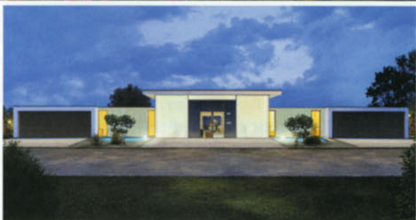
FOTOGRUNDRISS: Cubus Designhaus GmbH