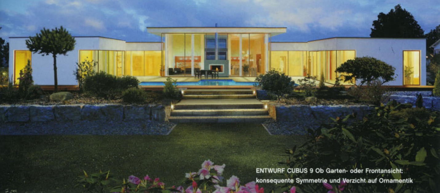
ENTWURF CUBUS 9 Ob Garten- oder Frontansicht: konsequente Symmetrie und Verzicht auf Ornamentik