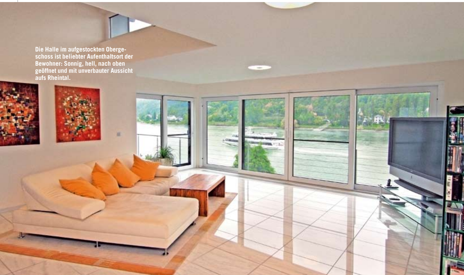
Die Halle im aufgestockten Obergeschoss ist beliebter Aufenthaltsort der Bewohner: Sonnig, hell, nach oben geöffnet und mit unverbaute Aussicht aufs Rheintal.

reine Wohnfläche über die beiden oberen Etagen verteilt. Die Anbindung an die bestehende Bausubstanz erforderte einiges an Abstimmungsarbeit, was aber der Fertighaushersteller problemlos meisterte.