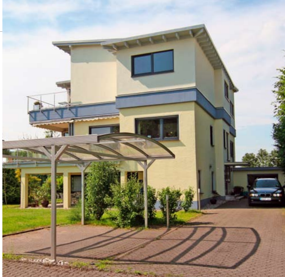
Das ursprünglich zweigeschossige Gebäude wurde mit Fertigteilen um ein Geschoss erweitert. Im Erdgeschoss liegen Eingang und Büroräume.