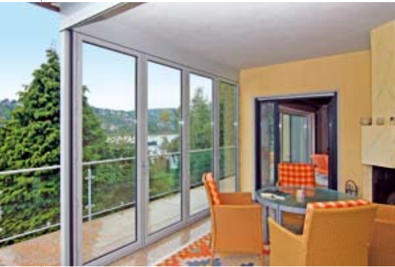
Gemütliche Sitzplätze bieten der Wintergarten und die schicke, großzügige Bibliothek – natürlich immer mit entspannendem Fernblick.